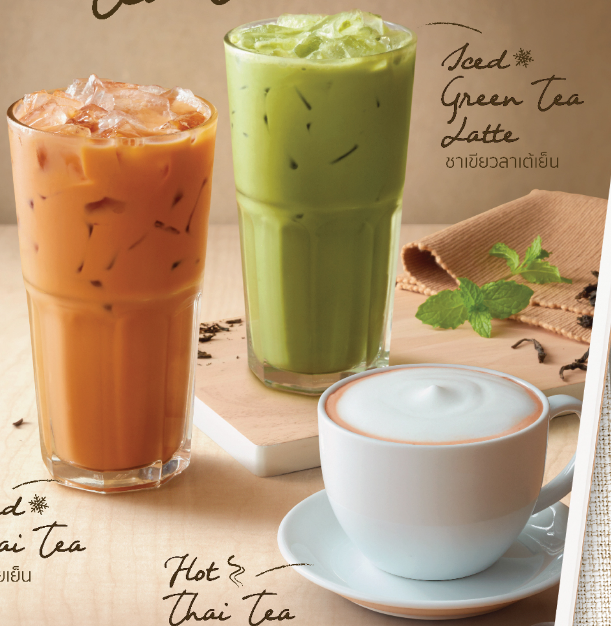
Seed Green Tea Latte ชาเขียวลาเต้เย็น