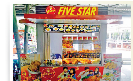
สถานีบริการน้ำมัน / Gas Station / 加油站