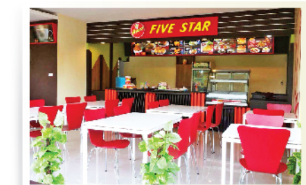
โรงงาน / Factory / 工廠