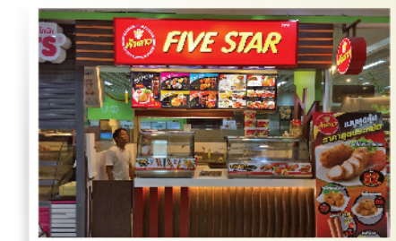
ห้างสรรพสินค้า / Department store / 百貨商場