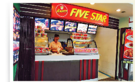
โรงพยาบาล / Hospital / 醫院