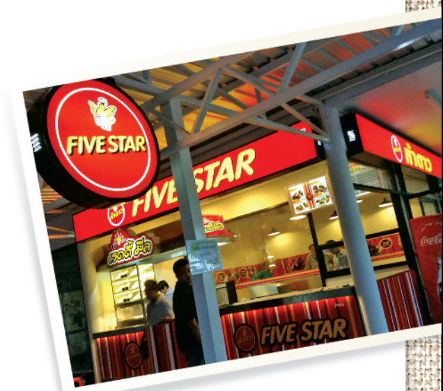
มหาวิทยาลัย / University / 高等院校